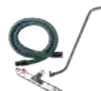
Široká řada antistatických příslušenství